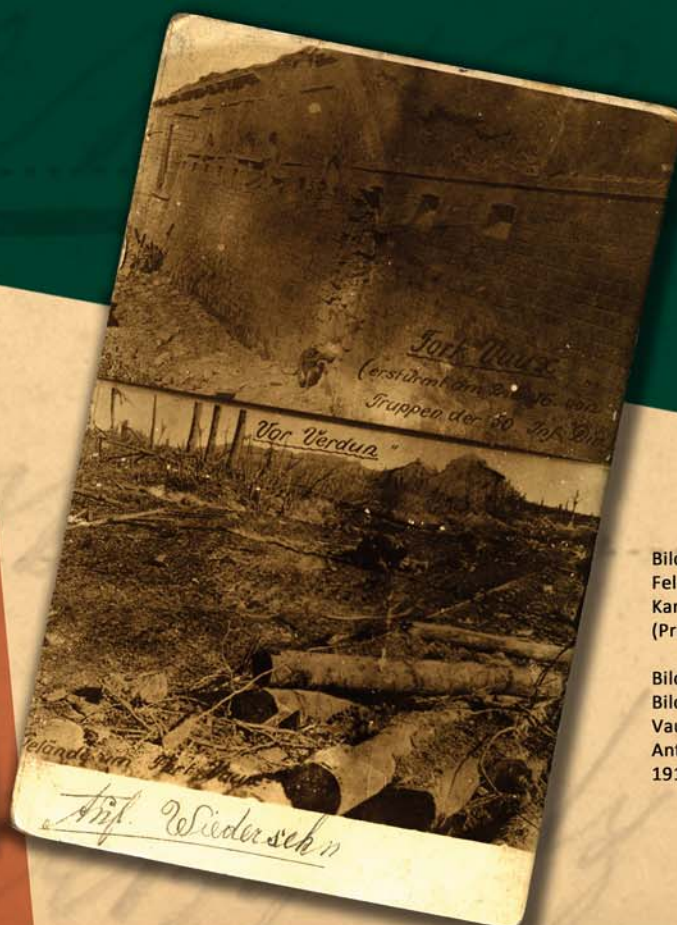
Bild (links): Somme-Schlacht Feldpostkarte mit dem Gedicht „Im Kampf an der Somme“ von Otto Jansen